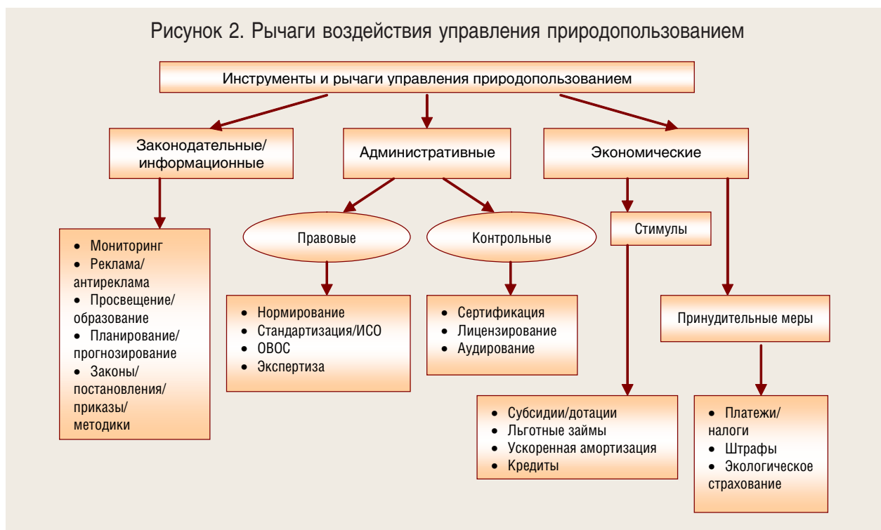
Рисунок 2. Рычаги воздействия управления природопользованием

функцией обладают процессы сертификации и лицензирования [17]. Важное значение в законодательно-информационном регулировании имеют международные конвенции и соглашения. Так, правительства стран, ратифицировавших Киотский протокол, обязывают предприятия снижать выбросы парниковых газов, применяя для этого внутригосударственные законодательные и административные меры.