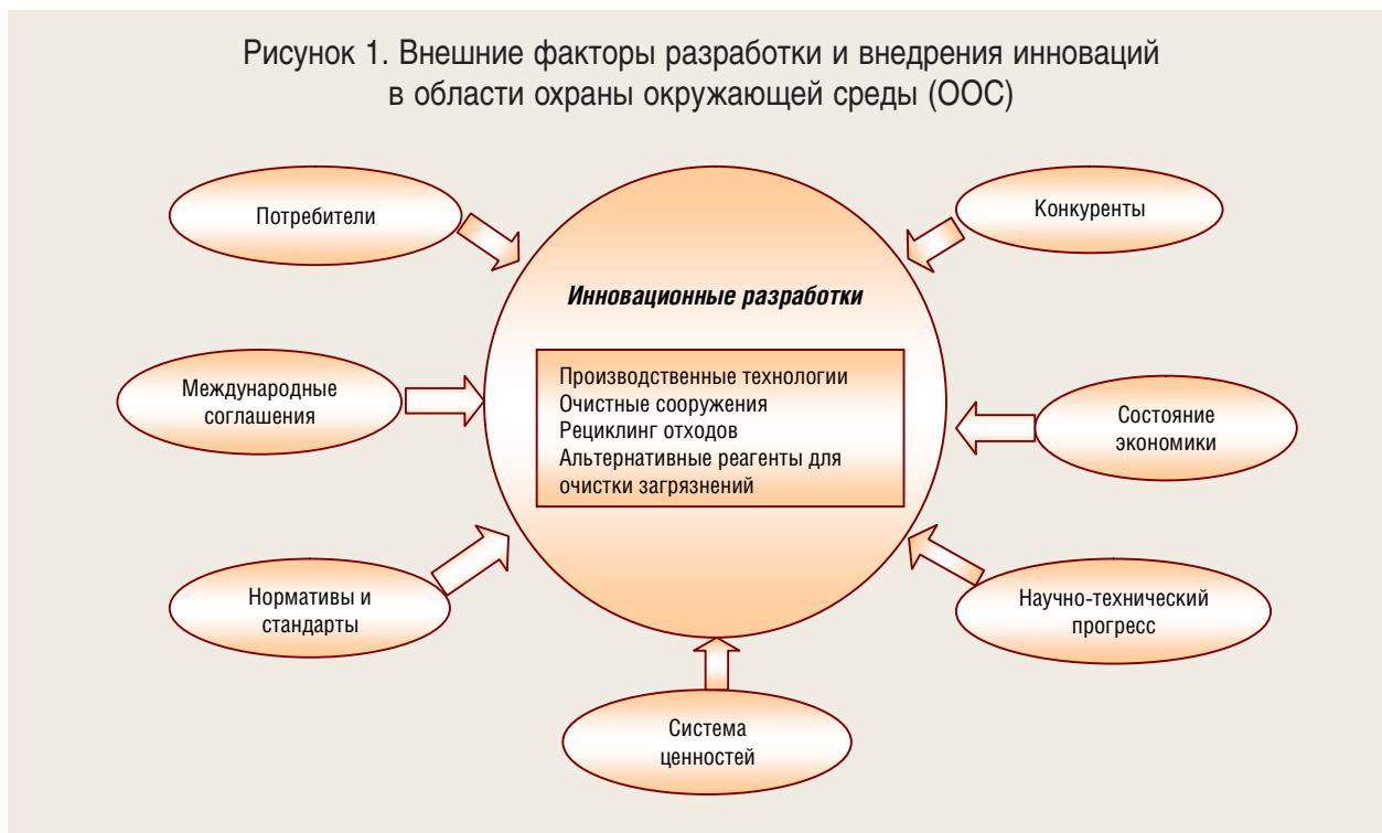
Рисунок 1. Внешние факторы разработки и внедрения инноваций в области охраны окружающей среды (ООС)

рования ставок платы, либо внедрения системы дифференцированного или жёсткого нормирования.