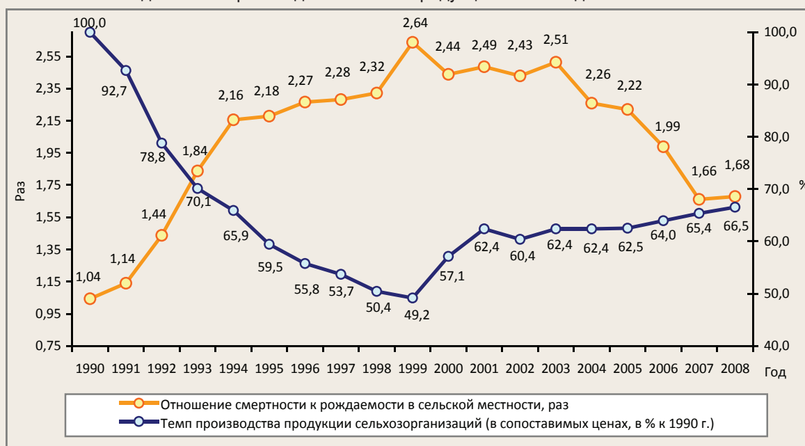
Рисунок 2. Превышение смертности над рождаемостью в сельской местности и динамика производства сельхозпродукции в Вологодской области

В сельской местности имеет место сверхвысокая смертность населения. Если в 1990 г. её уровень превышал уровень рождаемости в 1,04 раза, то в период с 1994 по 2005 г. число умерших было в 2–2,6 раза