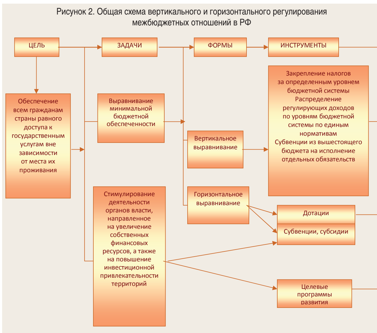
Рисунок 2. Общая схема вертикального и горизонтального регулирования межбюджетных отношений в РФ

нальные и местные власти, во-первых, ответственность за финансовое обеспечение закреплённых за ними функций и предоставление населению соответствующих услуг либо государственным учреждением и организацией, либо через частный сектор; во-вторых, обязанность эффективно и ответственно использовать свои права по сохранению и увеличению собственного доходного, в частности налогового, потенциала. Инструментами вертикального регулирования межбюджетных отношений при этом, как следует из рисунка 2, являются: закрепление налогов за определённым уровнем бюджетной системы; распределение регулирующих доходов по уровню