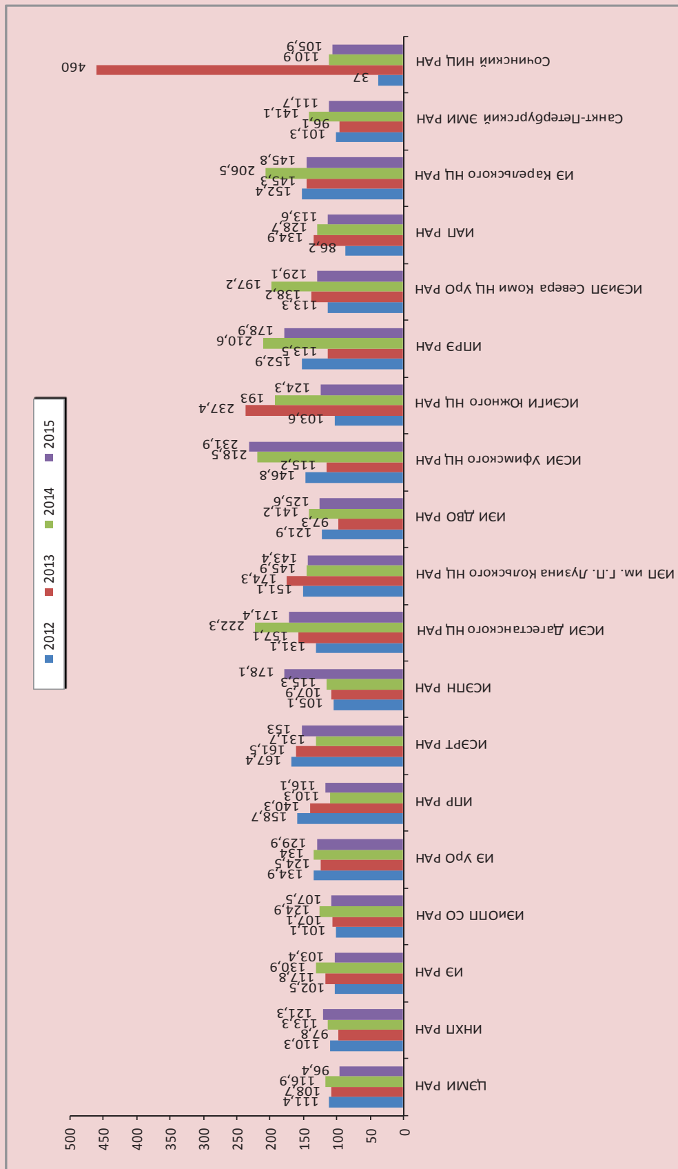
Рисунок 2. Темпы роста числа цитирований экономических институтов РАН в Российском индексе научного цитирования, % (данные НЭБ на 11.11.2016)