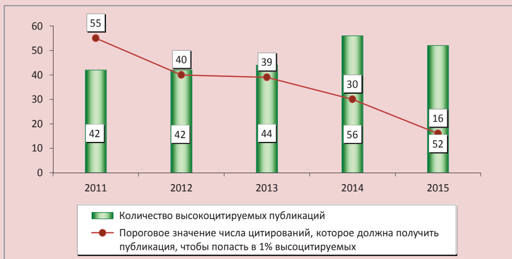
Рисунок 4. Распределение высокоцитируемых публикаций экономических институтов РАН за период 2011–2015 гг. (данные НЭБ на 11.11.2016)

Применение описанной методики позволило выделить 236 высокоцитируемых публикаций экономических институтов РАН за период 2011–2015 гг. На рисунке 4 представлены данные о числе таких публикаций за каждый год обозначенного периода. Здесь же приведены пороговые значения числа цитирований,