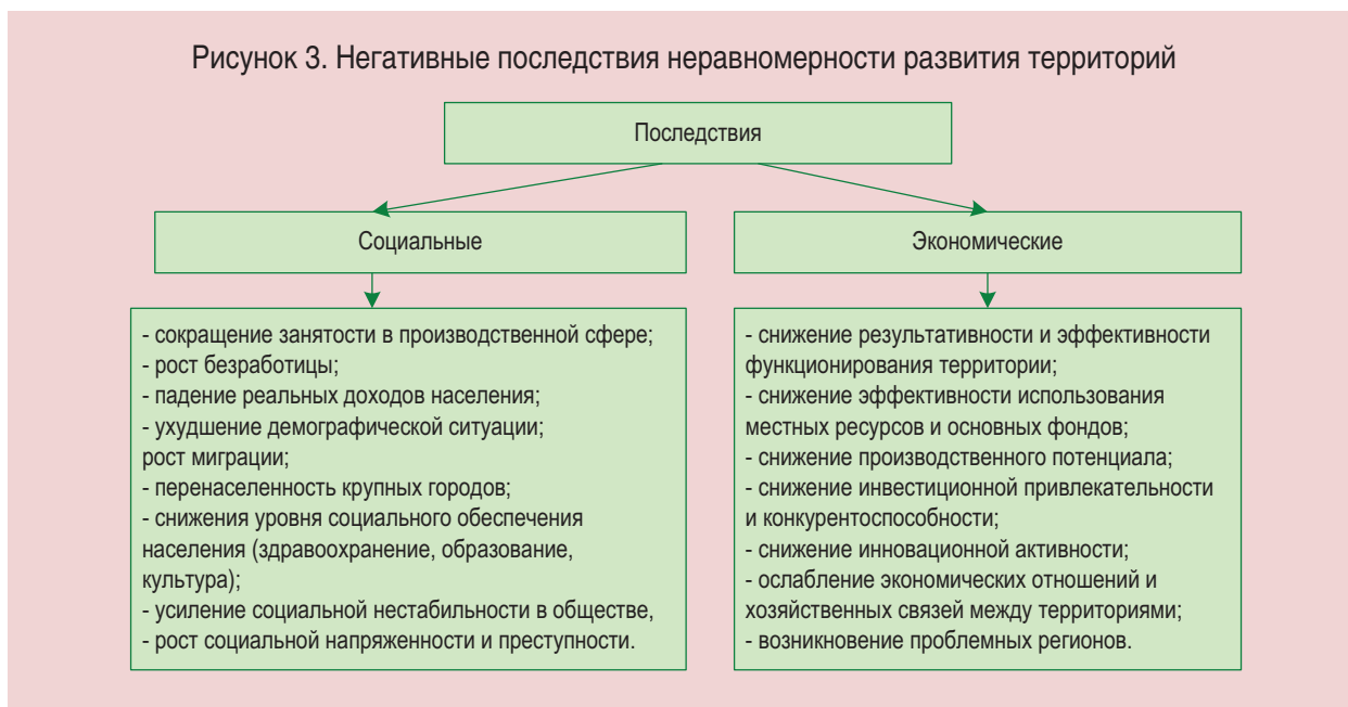
Рисунок 3. Негативные последствия неравномерности развития территорий

ятные территории, а это, в свою очередь, приводит к «угасанию» развития и «вымиранию» целых населённых пунктов [38, с. 65]. При этом увеличение различий между территориями по ряду социально-экономических параметров дестабилизирует развитие экономики и социальной сферы, нарушает устойчивое и сбалансированное развитие территорий, целостность и единство социально-экономического пространства.