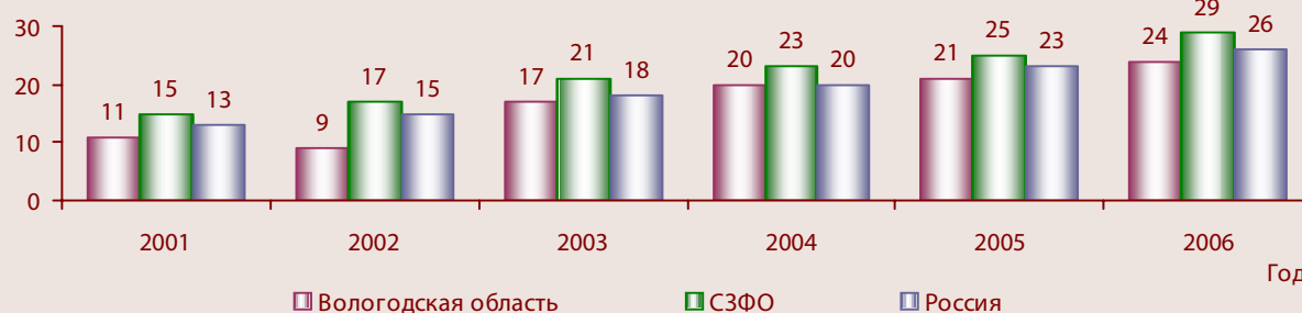
Рисунок 4. Количество выданных охранных документов на изобретения и полезные модели на 100 000 населения

показателя в регионе в течение рассматриваемого периода с 4 до 9 патентов на 100 000 населения 19 , его значение в 2006 г. было ниже среднероссийского в 2,3 раза (рис. 4).