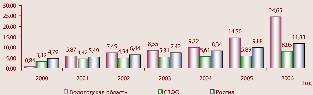
Рисунок 3. Число использованных передовых производственных технологий на 10 000 населения, ед.

В 2006 г. в структуре использованных передовых производственных технологий в регионе, как и в стране в целом, наибольший удельный вес имели разработки в таких областях, как проектирование и инжиниринг – 25,9% (в России – 30,1%), производство, обработка и сборка – 32,9% (29,9%), автоматизированные погрузочно-разгрузочные операции и транспортировка