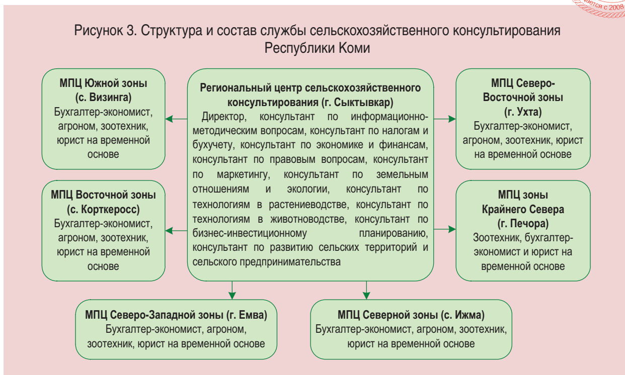
Рисунок 3. Структура и состав службы сельскохозяйственного консультирования Республики Коми

Для расширения доступа к информации и консультационным услугам сельхозтоваропроизводителей и сельского населения потребуется вовлечение сельских администраций. Их главы могут помочь организовать информационные уголки в библиотеках, помещениях сельских администраций, предоставить помещения для встречи сельских жителей с консультантами, прибывшими из центров аграрного консультирования, обеспечить связи владельцев личных подсобных хозяйств и семейных ферм с консультационными центрами, определить и обустроить базовые хозяйства, в которых можно демонстрировать передовой опыт.