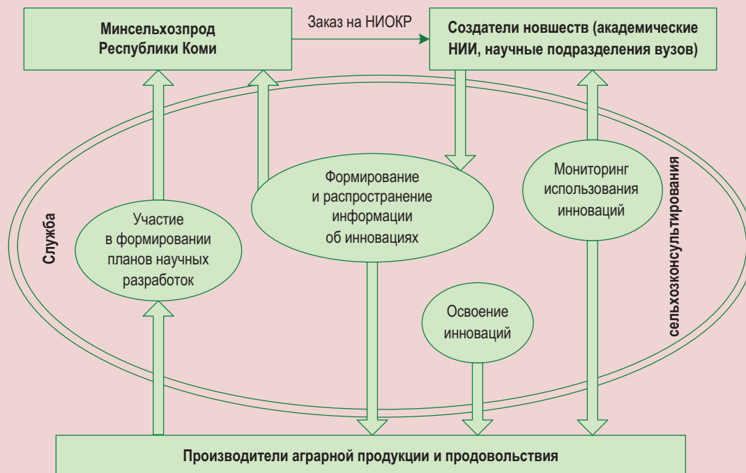
Рисунок 4. Схема участия региональной службы сельскохозяйственного консультирования в освоении инноваций

Изучение специфики формирования, состояния и развития аграрного консультирования в северном регионе позволяет сделать ряд выводов и предложений.