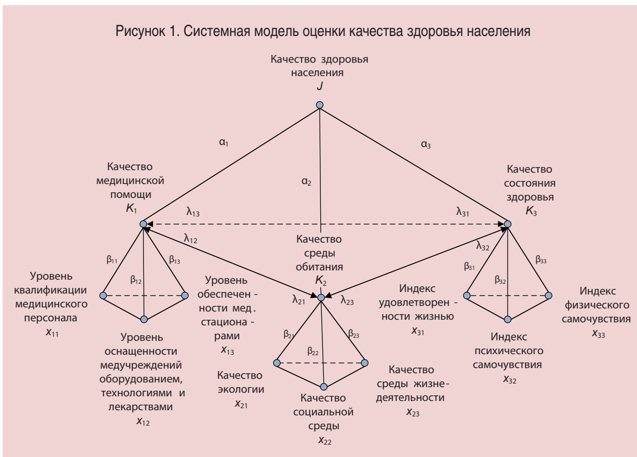
Рисунок 1. Системная модель оценки качества здоровья населения

Каждый из компонентов, в свою очередь, может быть декомпозирован и представлен в виде триад взаимосвязанных объективных и субъективных показателей нижнего уровня (частных показателей). Частные показатели могут определяться как на основе официальных данных,