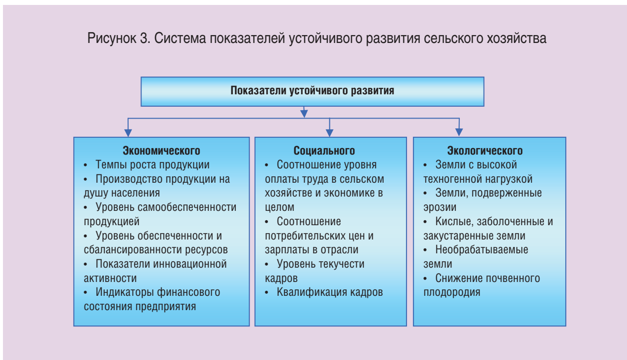
Рисунок 3. Система показателей устойчивого развития сельского хозяйства

Показатели устойчивости должны удовлетворять следующим критериям: возможность количественного выражения и использования на уровне страны, региона, отрасли, предприятия; опираться на имеющуюся статистическую отчетность; использование ограниченного количества основных индикаторов.