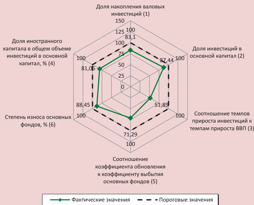
Рис. 4. Оценка остроты кризисной ситуации в инвестиционной сфере РФ (расчеты авторов)

Необходимость активизации и интенсификации инвестиционной деятельности в экономике России для улучшения ее состояния и преодоления автономной рецессии также подтверждается результатами проведенного нами индикативного анализа уровня инвестиционной безопасности. Для визуализации результатов использована лепестковая диаграмма, содержащая нормированные индикаторы инвестиционной безопасности РФ в 2015 г. (рис. 4). Наибольшее опасение вызывают индикаторы «Соотношение коэффициента об-