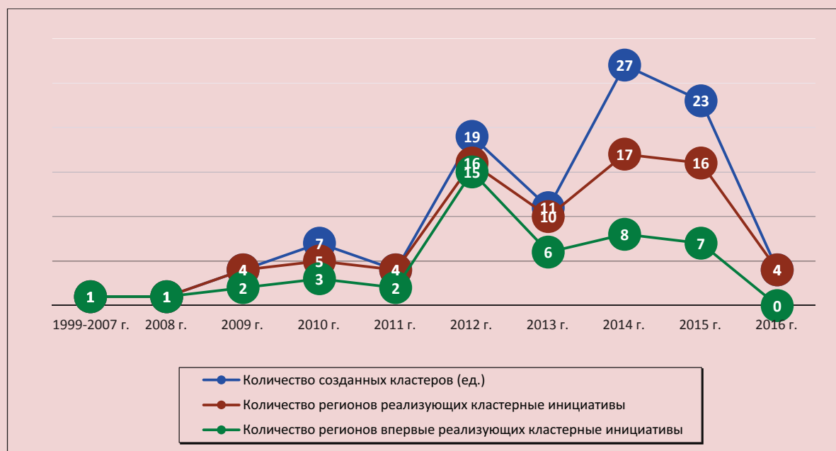
Рис. 2. Волны кластеризации экономики российских регионов