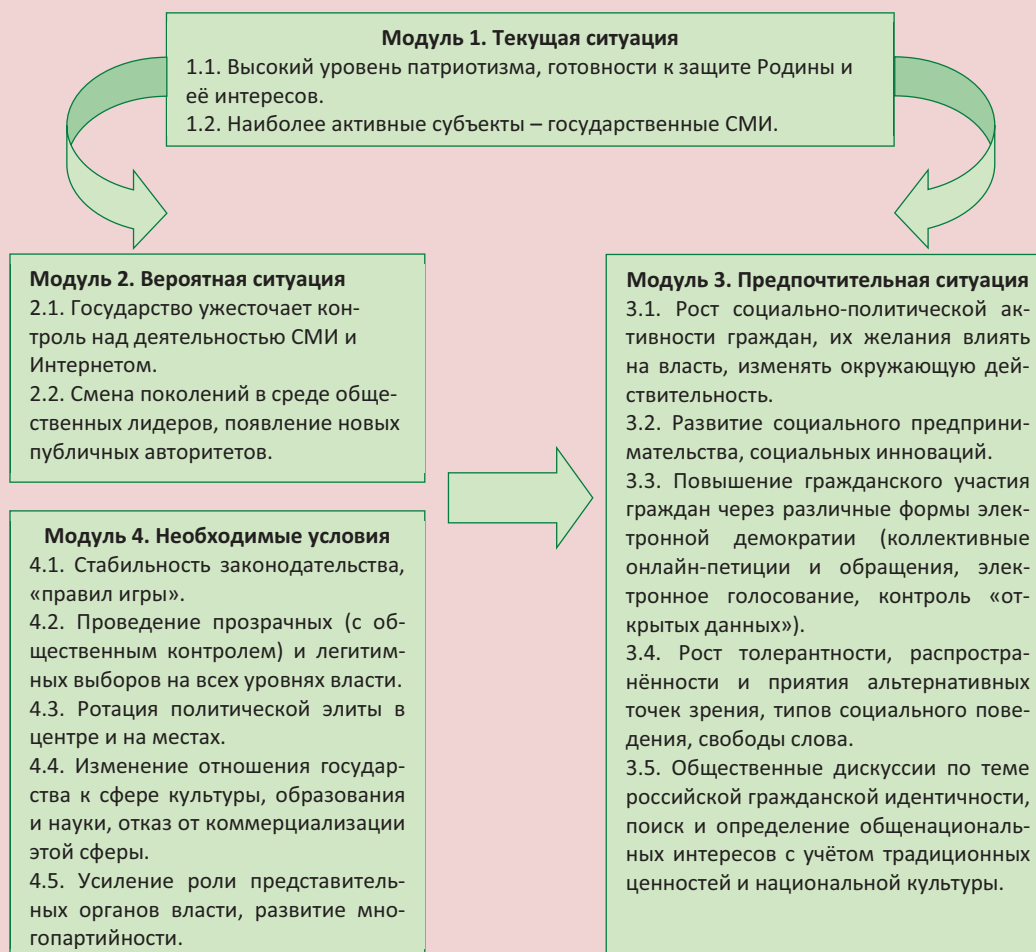
Рисунок 8. Схема экспертного образа гражданского общества*