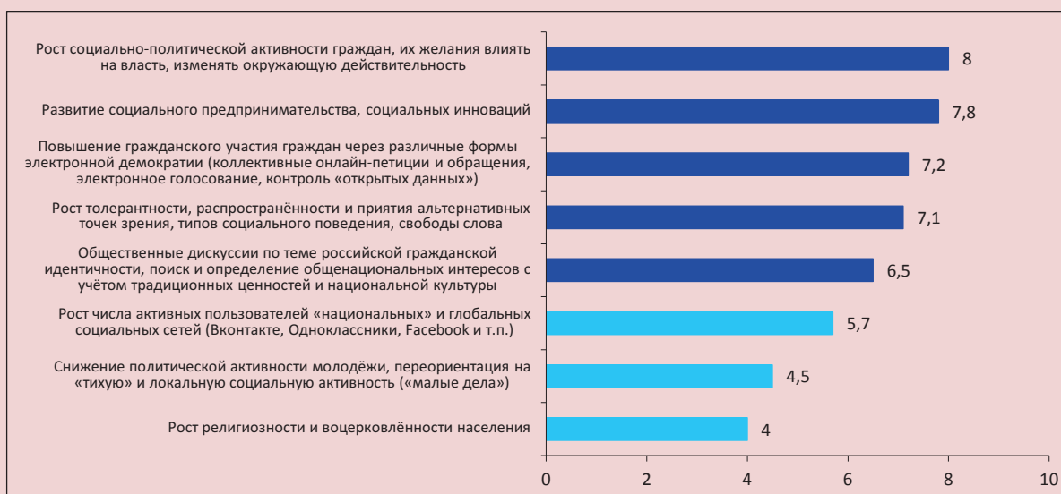
Рисунок 6. Предпочтительные изменения для успешного развития российского гражданского общества в ближайшие 5 лет*

* Оценка желательности каждого события по 10-балльной шкале, где «1» – совершенно нежелательно, «10» – крайне желательно. Ранжировано в порядке убывания среднего балла.