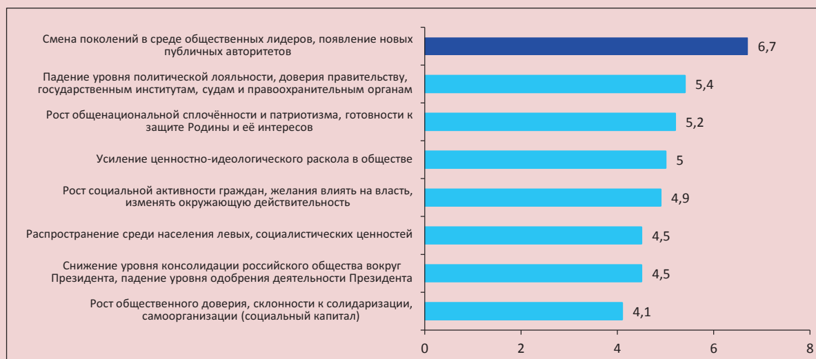
Рисунок 5. Вероятность осуществления в ближайшие годы (5 лет) изменений в сфере гражданского общества*

* Ранжировано в порядке убывания среднего значения вероятности.