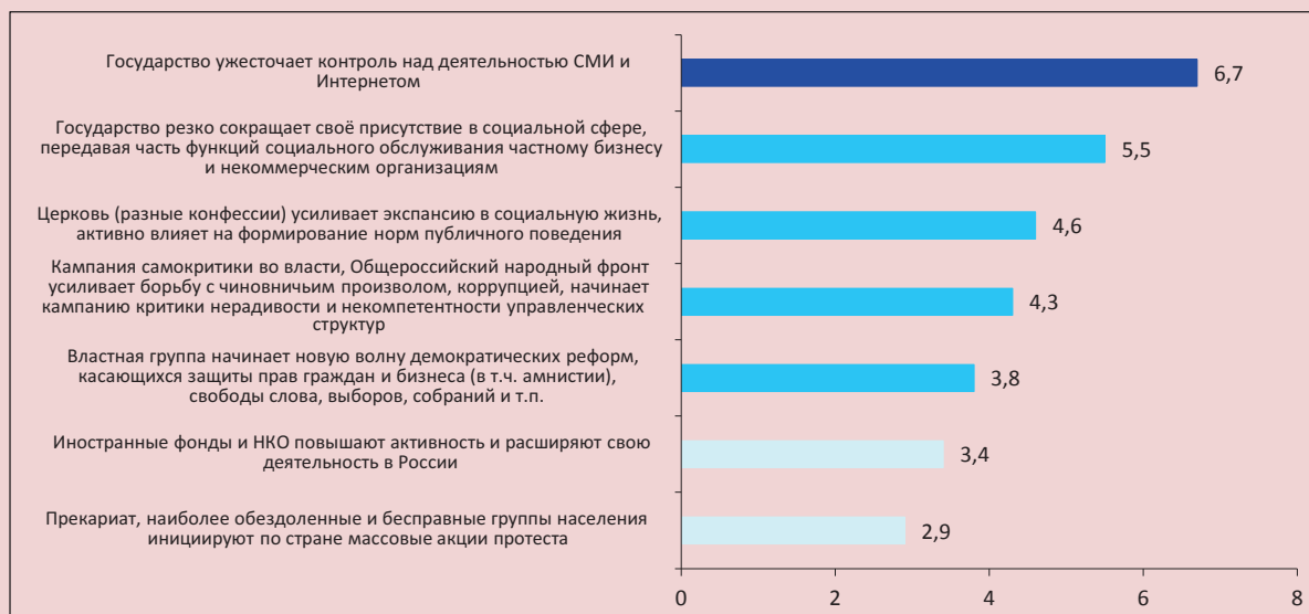
Рисунок 4. Вероятность действий основных субъектов общественно-политических процессов в ближайшие 5 лет*

* Ранжировано в порядке убывания среднего значения вероятности.