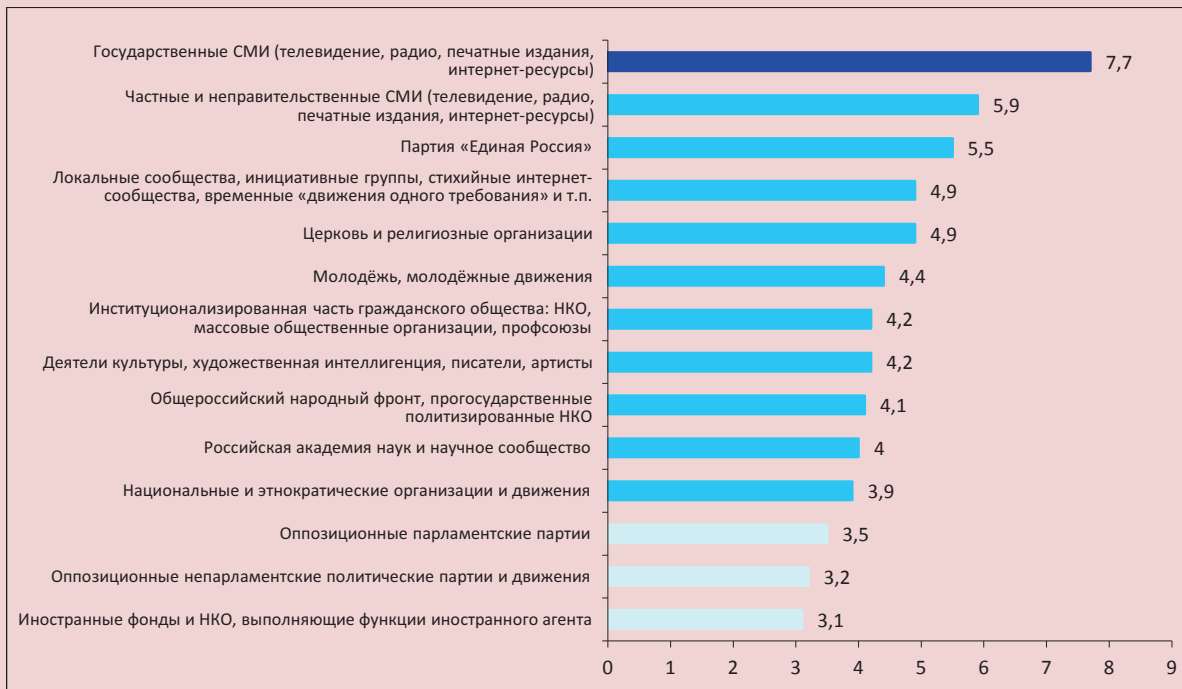
Рисунок 3. Влияние субъектов гражданской сферы на развитие российского общества в ближайшую пятилетку*

* Оценка степени влияния каждого субъекта (актора) по 10-балльной шкале, где «1» – какое-либо влияние отсутствует, «10» – очень сильное влияние. Ранжировано в порядке убывания среднего балла.