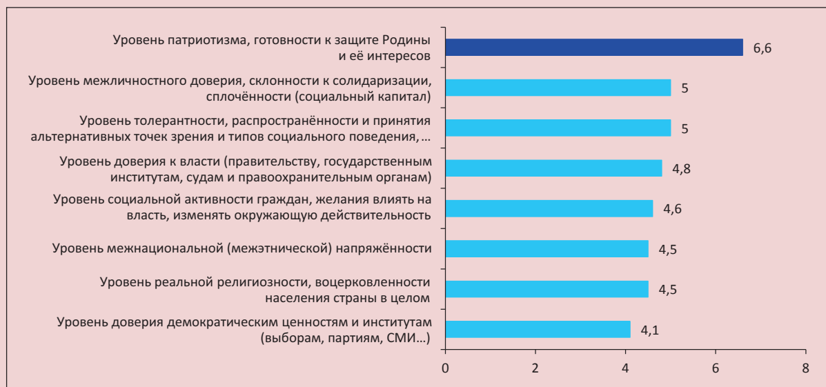
Рисунок 1. Социальный контекст функционирования гражданского общества*

Здесь и далее используются условные обозначения: