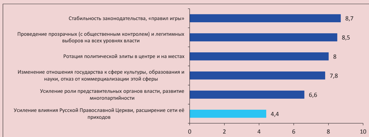
Рисунок 7. Условия для достижения предпочтительной ситуации в сфере российского гражданского общества*

* Оценка необходимости каждого фактора, условия по 10-балльной шкале, где «1» – нет никакой необходимости, «10» – совершенно необходимо. Ранжировано в порядке убывания среднего балла.