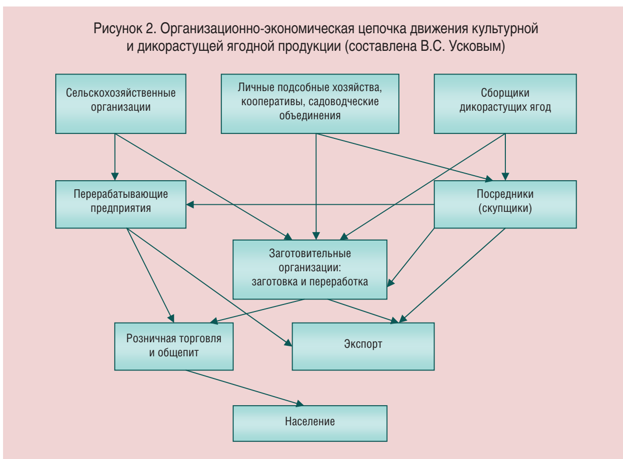
Рисунок 2. Организационно-экономическая цепочка движения культурной и дикорастущей ягодной продукции (составлена В.С. Усковым)

Будем надеяться, что провозглашенный нынешними властями курс в этом направлении станет действенным. И тогда развитие рынка плодово-ягодной продукции