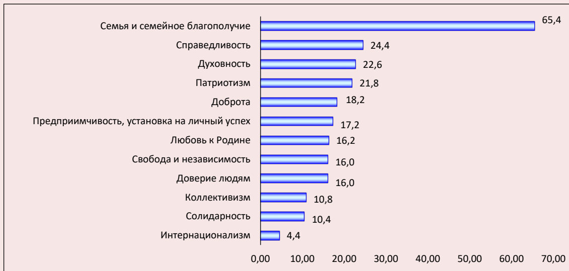
Рис. 4. Распределение ответов респондентов на вопрос «Какие из перечисленных ценностей наиболее востребованы в настоящее время? (укажите не более трех вариантов ответа)», % от числа опрошенных