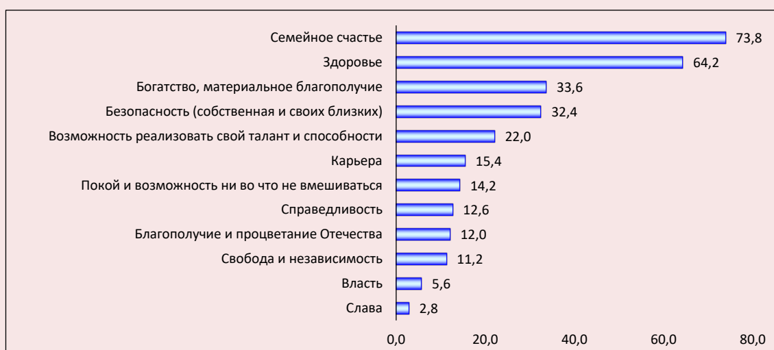
Рис. 3. Распределение ответов респондентов на вопрос «Что для Вас сегодня является главным в жизни? (укажите не более трех вариантов ответа)», % от числа опрошенных