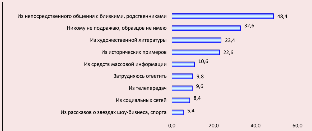
Рис. 6. Распределение ответов респондентов на вопрос «Откуда Вы обычно берете образцы для своего поведения (укажите не более трех вариантов ответа)?», % от числа опрошенных