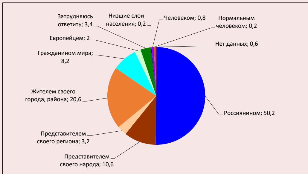
Рис. 1. Распределение ответов респондентов на вопрос «Кем Вы себя ощущаете прежде всего?»*, % от числа опрошенных