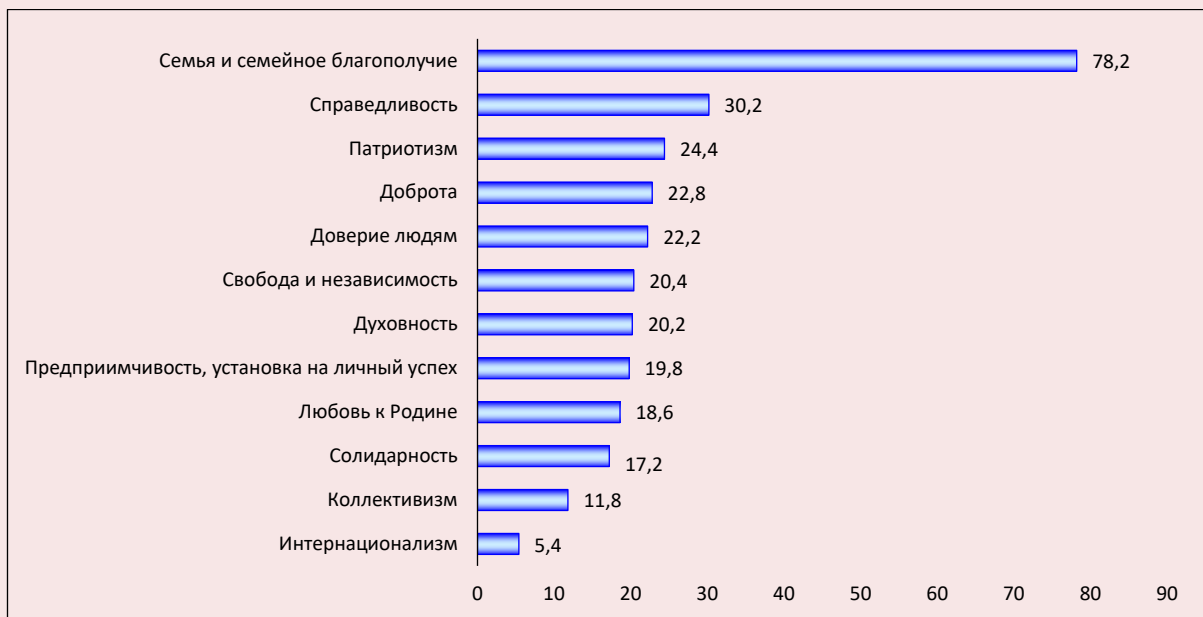
Рис. 2. Распределение ответов респондентов на вопрос «Какие традиционные ценности представляются Вам наиболее значимыми? (укажите не более трех вариантов ответа)», % от числа опрошенных