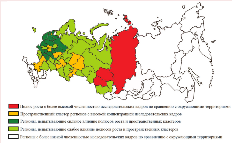
Рис. 1. Пространственная кластеризация регионов по численности научно-исследовательских кадров в 2020 году

Для подтверждения высокой значимости данных факторов в становлении и углублении пространственной неоднородности инновационного развития России был проведен пространственный автокорреляционный анализ их распределения по методике П. Морана (рис. 1, 2).