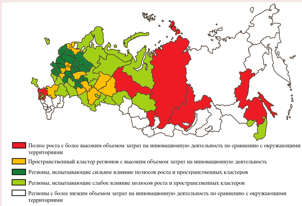
Рис. 2. Пространственная кластеризация регионов по объему осуществляемых предприятиями затрат на инновационную деятельность в 2020 году