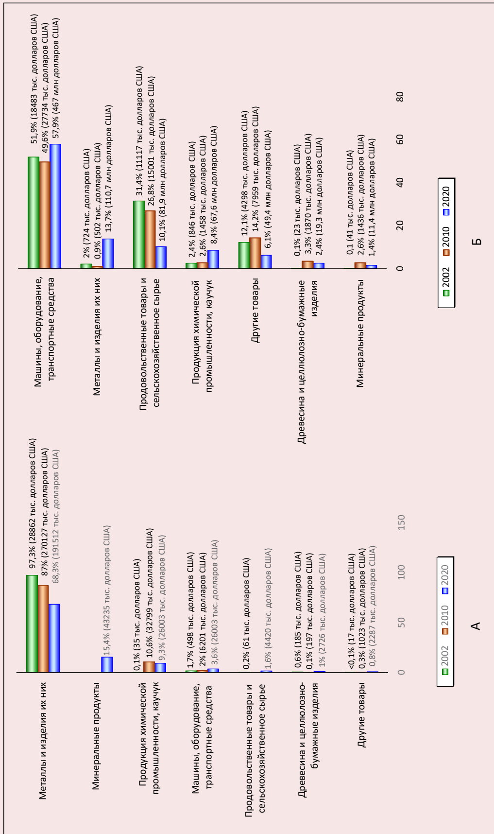
Рис. 2. А – Динамика структуры экспорта товаров из Вологодской области в Республику Беларусь (2002–2020 гг.); Б – Динамика структуры импорта товаров в Вологодскую область из Республики Беларусь (2002–2020 гг.)