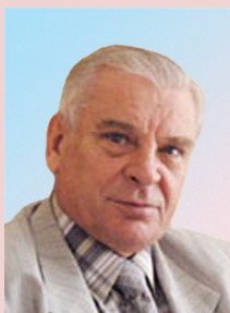
Александр Иванович ТАТАРКИН

академик РАН, директор Института экономики Уральского отделения РАН tatarkin_ai@mail.ru