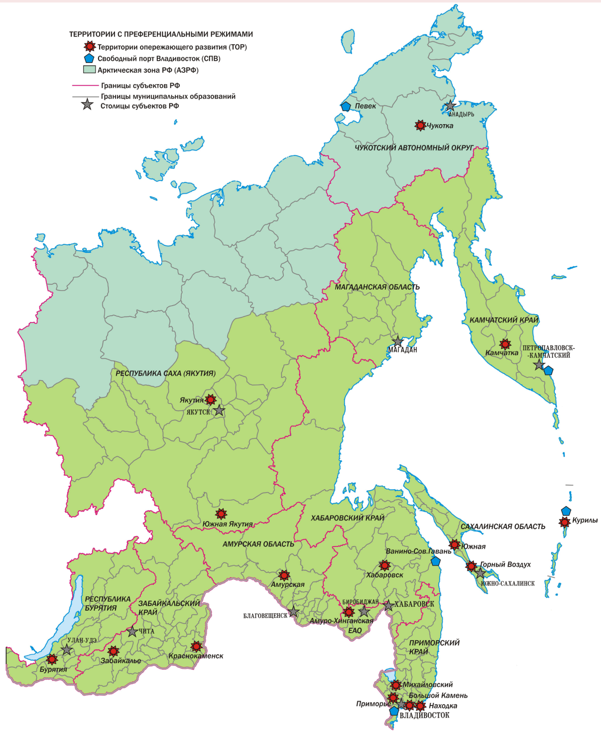
Рис. 1. Основные преференциальные режимы ДВ России

Источник: составлено В.Д. Хижняком по Годовому отчету о деятельности Корпорации развития Дальнего Востока и Арктики за 2023 г.