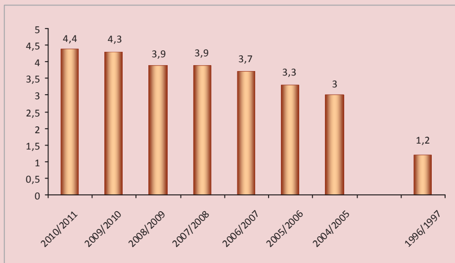
Рисунок 2. Общая выручка 20 ведущих клубов Европы, млрд €