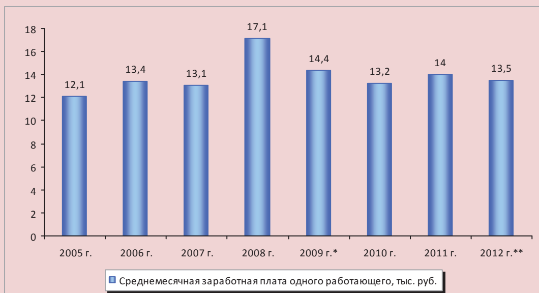
Рисунок 2. Среднемесячная заработная плата одного работника малого предприятия Вологодской области (в сопоставимых ценах 2012 г.), тыс. руб.

В сфере оптовой и розничной торговли; ремонта автотранспортных средств, мотоциклов, бытовых изделий и предметов личного пользования, где сосредоточен наибольший процент работников,