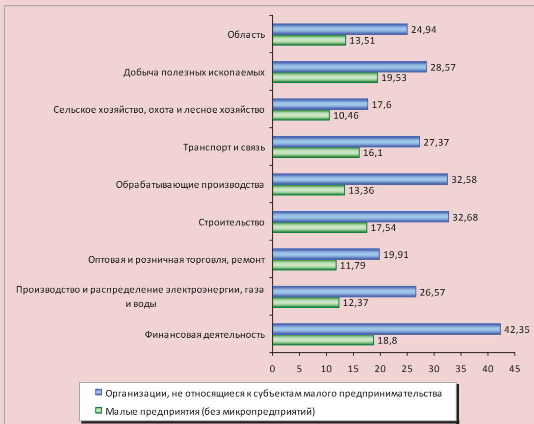
Рисунок 3. Среднемесячная заработная плата работников малых предприятий (без микропредприятий), организаций, не относящихся к субъектам малого предпринимательства, по отдельным видам экономической деятельности в 2012 г., тыс. руб.