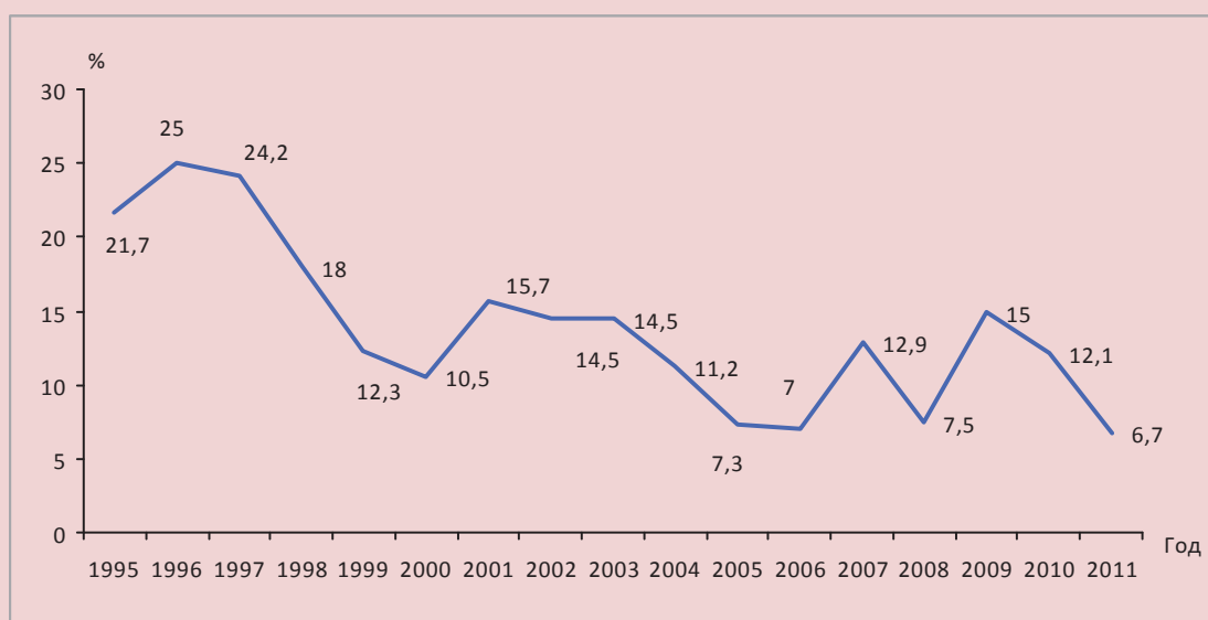
Рисунок 2. Характеристика финансовой помощи по показателю компенсации

Преодоление несбалансированности российской бюджетной системы не должно сводиться к простому покрытию дефицитов региональных бюджетов, переложению расходной ответственности с одного уровня бюджетной системы на другой или незначительным налоговым корректировкам. Поиск решений накопившихся проблем должен носить системный характер, и понимание того, по каким принципам, конкуренции или кооперации, построена модель бюджетного федерализма, даст возможность проведения адекватных и успешных реформ.